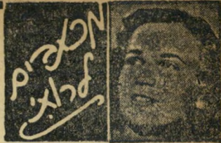
נתבקשת להדפיס שורות אלה כל שונן מיד תבינו מדוע: