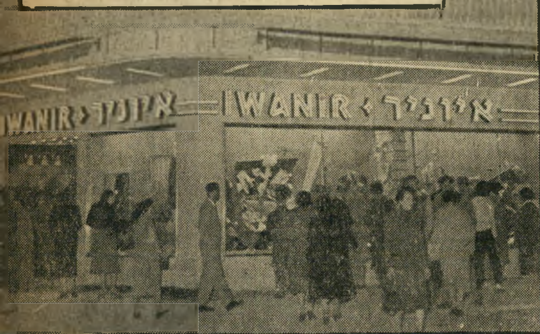
בתוככי המרכז החברתי והמסחרי החדש של תל-אביב, פתח בשבוע שעבר איוניר בית אופנה חדיש ביותר.