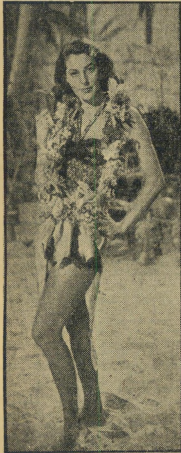
ארה גארדנר מי מוכן עמה?

מי יטפל בכיכב? עתונאי זריו לא התעצל, מיהר לודא אם חלומותיהם של שבעת המועמדים, עולים בקנה אחד עם שאיפותיה של ארה. אמר עדלי סטיבנסון: "הבחירה מחניפה לי. היכן נמצא האי?"