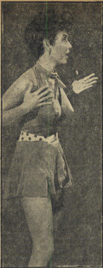
מורנו ב"שמלה לך, קצין תהיה" יתרונות בולטים

פוס האידיאלי של הלא-יוצלת הכרוני, נראה התרטי המשעשע, כהרבה למטה מכוחותיו.