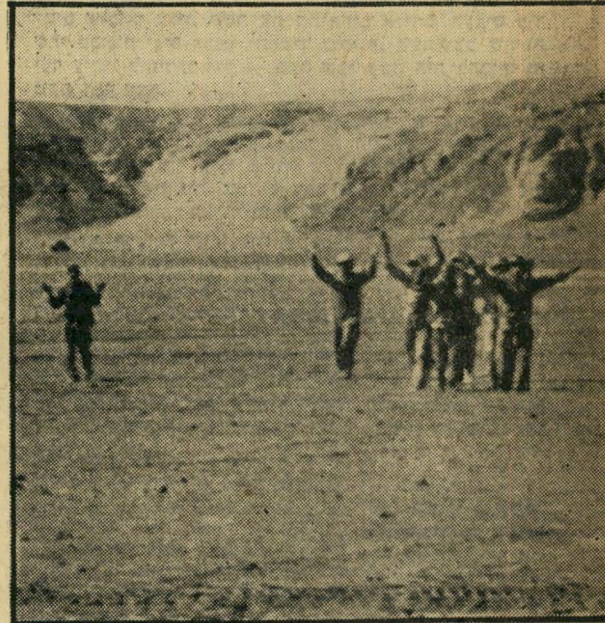
השבויים הראשונים. עוד לפני פתיחת הקרב הניקרי, הכניעו מטוסי חיל האוויר עמדת מקיב מצרי, שחולשה על הכביש לשארם אל-שייך. גיפ עלה על הגבעה ואסף את חיילי העמדה הנבוכים.

תם, מתחבקים ומתנשקים. המקלען, לידי, מנשק את המקלע שלו. ושוב מנקרת המחשבה המטרידה במוחנו: האם יספיק לנו הדלק? לפי התוכנית, היינו צריכים להכות בנאבק עד להג- חתת דלק ורק אז להתקדם הלאה. אך העיכוב בהאדי אתמול בלילה אילץ אותנו לשנות את התוכנית. ונחתות חיל הים הביאו את מיטענן לדבה, לצרכי החלק האחרון של השיירה, ואילו אנו כאן נוסעים ללא כל רזרבה של דלק. ההוראה של מפקד החטיבה היא: לנסוע עד הטיפה האחרונה במיכל. מכונית שהדלק יאול לה, תעמוד ותחכה עד שיופיעו החול- יות העורפיות עם דלק. ואיש אינו רוצה לצאת מהמירוץ.