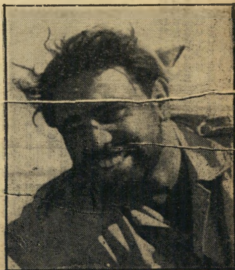
מפקדו של המפקד. כך קראו לעכו, יליד מצרים בן ה-25, שתפקידו סמל סכני, נהגו של המח"ס.