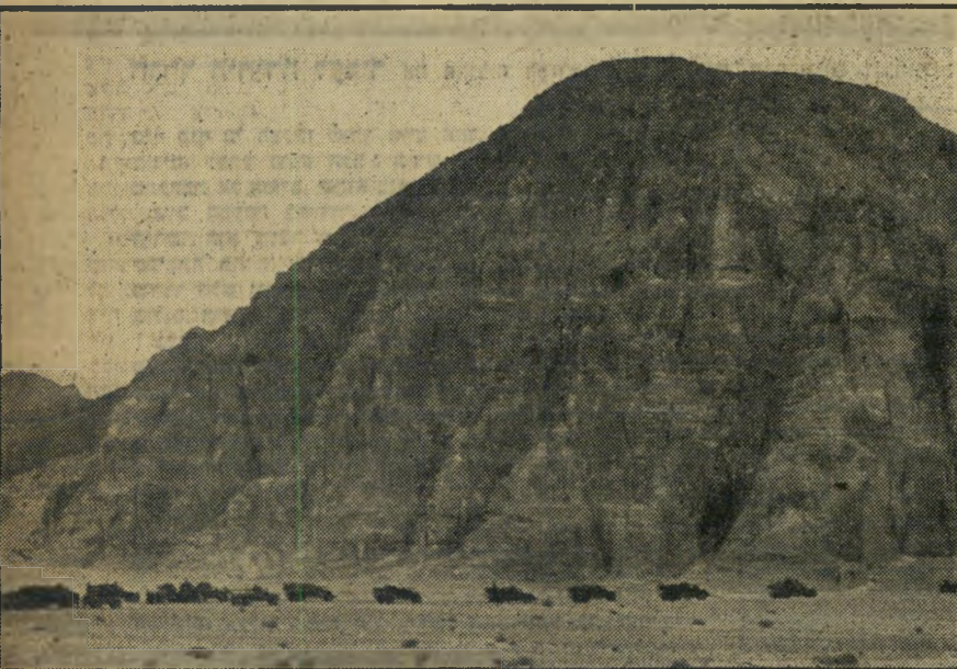
השיירה מתקדמת בוואדי, רגלי צוקי הענק של גרניס אדום. במשך היום הפיצוץ ההרים חום איום ובליה היו קרים כקרח. השיירה התמסכה לאורך של קילומטרים רבים.