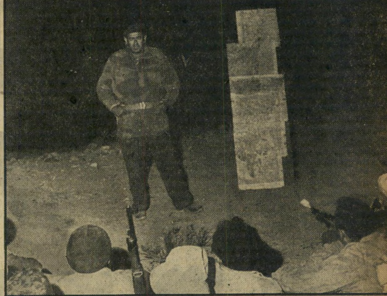
המפקד מסביר. אברהם יפה, מפקד החטיבה, מודיע לאנשיו על התחלת הקרבות בחצי האי סיני. בעזרת מפה, הוא מסביר את המשימה שהוטלה על החטיבה: פריצה דרומה וכיבוש מיצרי אילת מידי הצבא המצרי. שעה שיחידות אחרות של צה"ל פועלות בצפון.