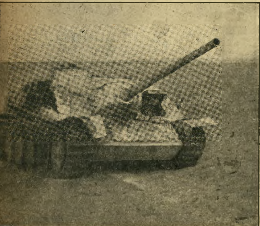
טאנק מצרי זה, מתוצרת סובייטית, בעל תותח בקוטר 85 מילימטרים, הוא אחד מרבים הטוסלים בצדי דרכים. הוא חוסל בקרב השריונים בדרך לאיסמעיליה. אתרים נלכדו והפעלו מיד.