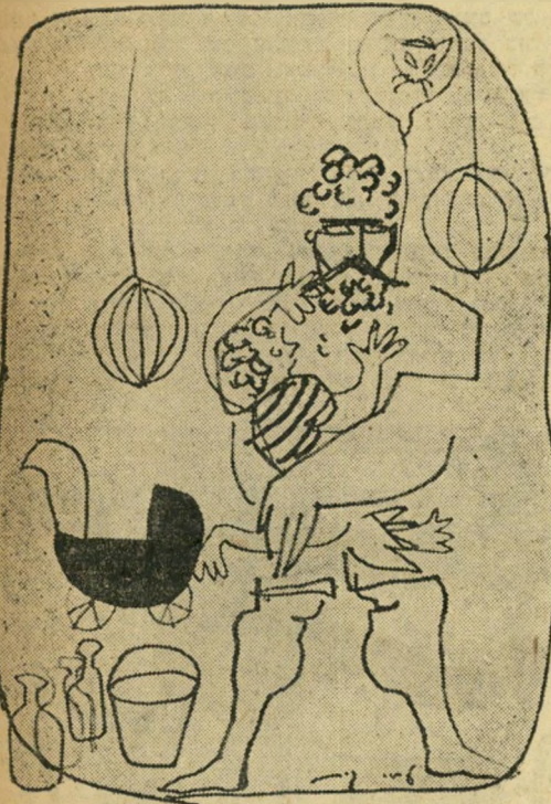
גייסו את אשתו.

אחת לכמה שנים, ב־29 בחודש, אחר כך אפשר להתפסס עשר שנים בזכרונות. ואפילו להתפנס.