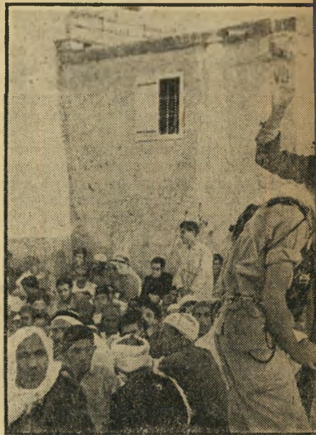
עזה, ביום הכיבוש, את הגברים הצעירים החשודים הם הצבאיים, התחפשו בבגדים אורחיים. אותם שזוחו שבויים. היחס אליהם היה תקיף אך הוגן.

נשים לבושות-שחורים סחבו גופה מתה בשמיכה. קבוצת נכים ביקשה סיגוריות מה-חיילים, שחילקו להם אותן ברצון. "סיגר