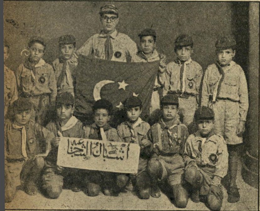
אזרחי המחר. קבוצת צופים ערביים בעזה, בתלבושתם הרשמית, ילדים אלה, שחונכו כספס מיום חיוולדם לשנוא את ישראל, עתידים להיות אזרחי-המחר של המדינה. תמונה זו נמצאה מתגוללת ברחוב הראשי של עזה, טעה קלה לאחר כיבוש העיר.

שמי בית-חנן האוירון המצרי האחרון של חיל האויר המצרי. הוא ירה כמה צורות חזר כלעומת שבא. כל השטח מעזה צטונה טוהר כולו.