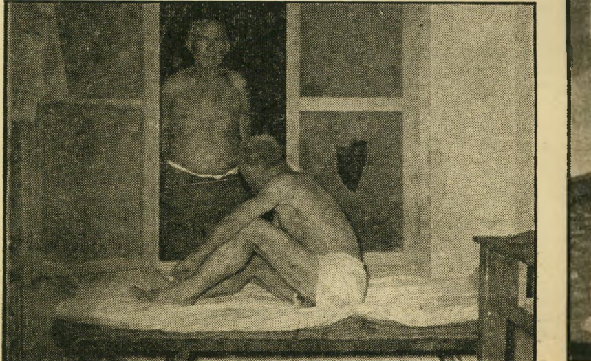
בריאות. רחוקים ממשפחותיהם ונשותיהם, מרגישים הפועלים — ביחוד הקשישים שבהם — את עצמם בודדים. הם מבליט את זמנם בקריאה ובשיחות הודיות. רק אחת לשבועיים הם מקבלים חופשה, נוסעים לשלושה ימים לביתם הרחוק, אל חיק משפחותיהם.

הם לא יחסו, באם יתפוצץ אחד הצינורות או יקרה קלקול אחר, להיכנס ערומים