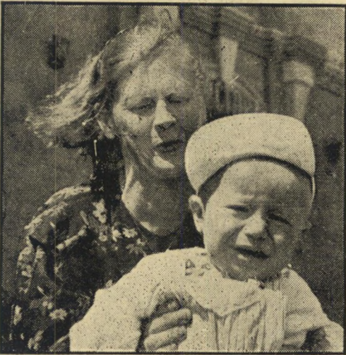
אם יילד. פועלת רוסייה מביאה בשעת הבוקר את בנה למועדון, שם יבלה את כל יומו עד שהאם תחזור מהעבודה ותקחהו חזרה לביתה. מחזה שיגרתו בעיר.

בצהרים היו בדרך כלל מונחים נחתי נק' גיק כמנה ראשונה. אבל אלה שהיו באים ראשונים היו גומרים אותם. הבשר שהוגש לנו היה רק בשר קצוץ או סחון.