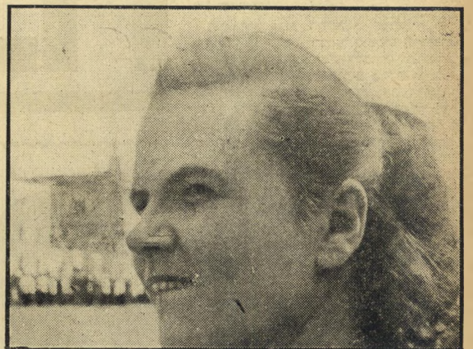
נערה רוסייה זו טיפוסית לנערות הרוסיות הנראות ברחובות מוסקבה. תסרוקתה היא התסרוקת האחדיה כמעט של כל הנשים. צבע שערותיה הבהיר, אפה המורס ועיניה הקטנות. הם פרטים שיתאימו כמעט לכל נערה במוסקבה.