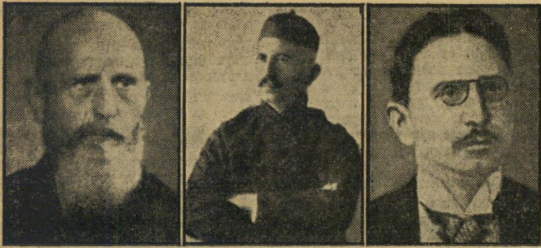
מריביטשדינקולן בשלבים שונים • גם היטלר, גם צ'רצ'יל היו שם