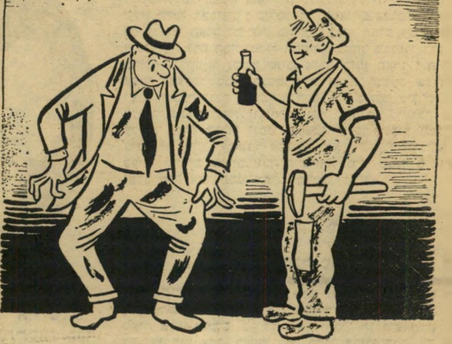
אתה דואג לבגדים!! תכנס אל א.ב.ג. ותזמין לך חליפה חדשה