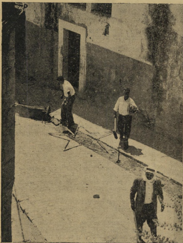
הפרועים עוזבים. הם סיימו את מלאכתם הרסנית בתוך המועדון, עזבו את המקום. בראש צעד כפוי נושא מקל רועים ארוך, אחריו צעיר נושא פטיש כבד בעוד שמתקיף שלישי שבר בבעיטות כוכב קומוניסטי שהושלך דרך החלון.

טרם הספיקו לפסוע כמה צעדים, נתקלו במארב הראשון. „אל תנסו להגיע לעיריה“, הזהירו אותם אנשי אל-זועבי. „אם תעשו עוד צעד אחד, נהרוג אתכם!“