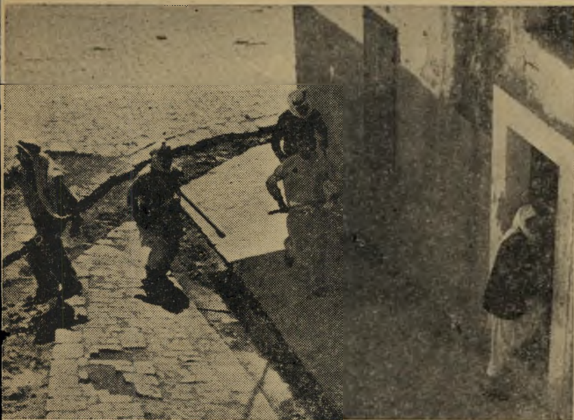
הפריצה. דלת המועדון הקומוניסטי נפרצה. אנשי אל-זועבי, מזוינים באלות, סכינים וגרזנים חזרו אל תוך הבית, לאחר שרגימה שיטתית ניפצה כמעט את כל שמשותיו של הבית בו נשאר רק נער ערבי אחד שגם הוא הוכה על ידי הפרועים.