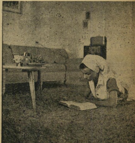
צרפתי: זיוה לומדת צרפתית כדי ללמוד פעם את אימות הפנסומימה במולדתה. המינוי האמריקאי בבית נובע ממתנות.