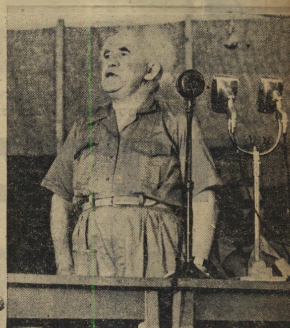
- נאם - בני חיפה אלה הקשיבו בדומיה לנאום, אף שלא הבינו מה זה "נונקופורמיזם" ולא התענינו בתורות הבודהא. חבריהם התליאביביים, בצד השני של האמפיטיאטרון, היו פחות אדיבים, צחקו ורעשו ללא הרף.