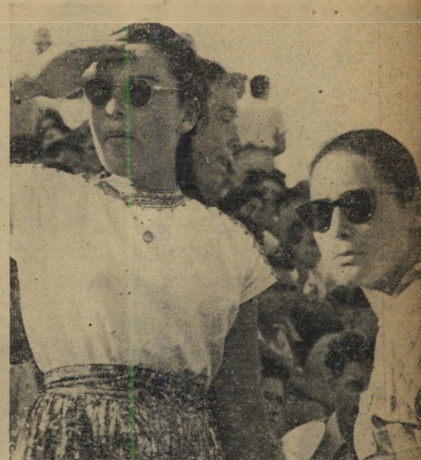
בני ג'י. בא - שתי צעירות אלה דאר אותו זו הפעם הראשונה בחייהן. אפילו מרחוק נראה עיף, נשען בכבוד על מקל תוך כדי הליכה. קשה היה לתארן כסנהיג ההולך לפני המחנה לקראת מיבצעים חלוציים.