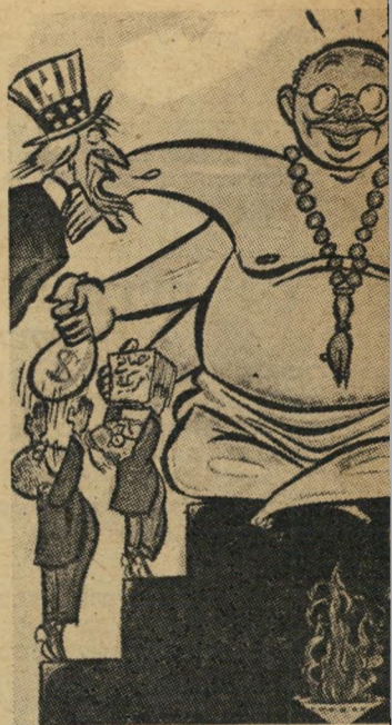
שזה נדאי להם..."

יתכן כי אין האשם בליגה הערבית כמסוד, כי אם בחבריה, אילו היו לה מנהיגים אחרים, טובים יותר, יתכן כי בכל זאת היתה מצליחה להגיע רחוק.