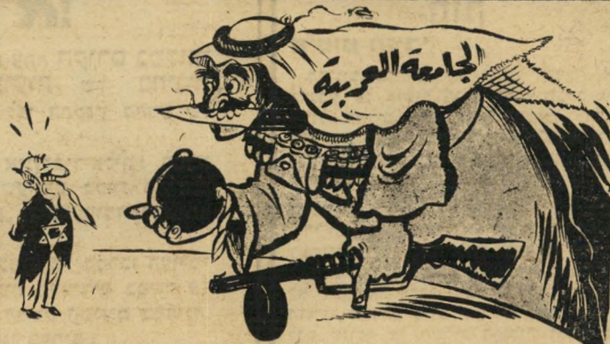
הליגה לוישראל: יש לך מזל. ידי הימנית עסוקה. שינו אינן פנויות. גם ידי השמאלית עסוקה. איך אתה רוצה שארביץ לך?

יחסה של הליגה ל' ישראל זוהי קורת קטלנית. קשה להבין כיצד שבע מ' דינות גדולות וחז' קות אינן יכולות ל' התגבר על עם קטן, שאין לו כל בסיס י' ציב. לליגה הערבית יש כל הדרוש כדי לחסל את ישראל — חסרי לה רק הרצון והיכולת להתגבר על הריב הפנימי.