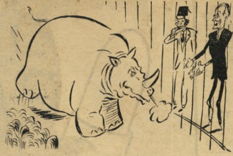
מנהיג העזרה הטכנית האמריקאית: נתן לו גם קרן נוספת.

צטרפותן של תורכיה ופאקיסטאן לרית הגנה עם אמריקה עוררה את חמת המצרים. האפשרות שעיראק תצטרף אף היא גרמה לשורת התקפות חריפות על כל המדינות הקטנות המוכרות את עצמן לאימפריאליזם האמריקאי, המתנאר כג' רוע לאפחוח מקודמו הבריטי והצר' פתי' בצ'וריס רביס מופיע אייזנהאור בלבוש מרט, אליל המלחמה הרומי.