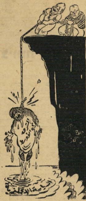
דאלס ואייזנהאור מר' ציאים את המרחב מכוכ' המדיניות הבריטית.