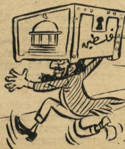
של או"ם: מפתח הארגון (פלסטין) בידי הליגה הערבית.

יחסה של הליגה ל' ישראל זוהי קורת קטלנית. קשה להבין כיצד שבע מ' דינות גדולות וחז' קות אינן יכולות ל' התגבר על עם קטן, שאין לו כל בסיס י' ציב. לליגה הערבית יש כל הדרוש כדי לחסל את ישראל — חסרי לה רק הרצון והיכולת להתגבר על הריב הפנימי.