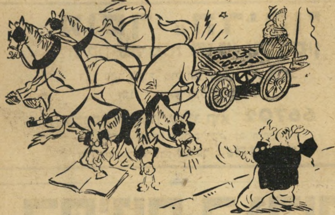
"בעצבם, מה אשמתו של העגלון? הסוסים הם חמורים!"

יתכן כי אין האשם בליגה הערבית כמסוד, כי אם בחבריה, אילו היו לה מנהיגים אחרים, טובים יותר, יתכן כי בכל זאת היתה מצליחה להגיע רחוק.