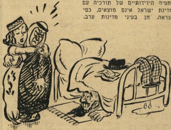
ערב לתורכיה: "החליטני או אני או המאהב הציוני שלך!"

יחסיה הידידותיים של תורכיה עם מדינת ישראל אינם מוצאים, כפי הנראה, חן בעיני מדינות ערב.