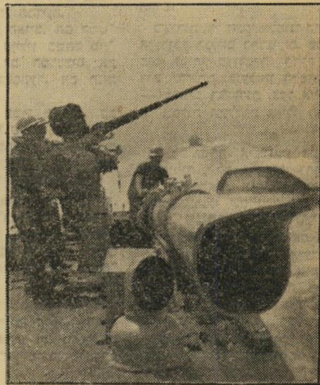
עמדות קרב. נסים ניצב ליד התותח האנטי-טנקי שלו, רפי ליד צינור הטורפדו.

לחזק על ההקדמך משך שנייה או שתיים, רק שלום ניצב ליד התורן כפסל, כש"רגליו פשוקות וידיו מושכות את הד"גלים הצבעוניים במעלה התורן וב"מורדו. על גשר הפיקוד ניצבו רק שני אנשים, רביסון מנשה ליפשיץ, שהוליך את