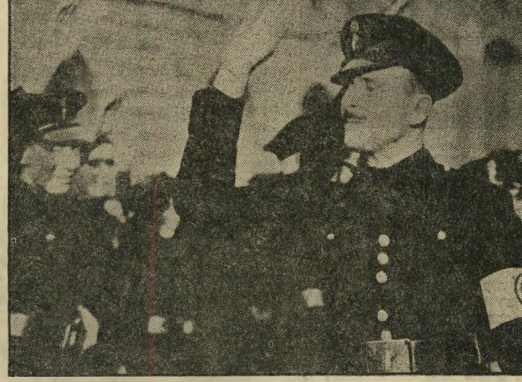
סיר אוסבלד מוסליי ומעריציו, 1934 מן הדוכיה, חולצה שחורה

אולם גיני לא רצתה להתקבל לעבודה. היו לה אמוציות חזקות הרבה מדי מכדי שתוכל לשבת במשרד ולתקק. ג'ו נאלץ לחזור אחריה משך כמה חודשים, עד שהסי