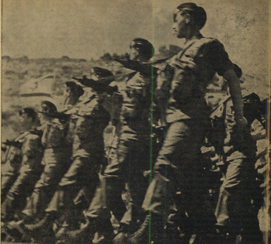
לעצור וזמני. אנות הפרשת הנזרות ביות, במלהמה בין מפא"י והצ"כ נסתיימה כנצחון מהדהד של בי. גיי.

אחר עבר בי. גיי. להתקפה נגדית מוחצת. טען הוא כישיבת הממשלה, בתמימות משכ־נעת: המושלים החדשים בשטחים הערביים לא ימלאו רק את שליחותו של שר אחר, הממונים במחוזות היהודיים, אלא יהיו, ל־מעשה, באי־כוח הממשלה כולה. הם יטפלו בעניני האוצר, הפנים, הדתות, החינוך, הכ־טחון. לאן יגיעו הדברים אם כל שר ידרוש לעצמו את המרות עליהם? קיצורו של יבר, כדי למנוע סכסוכים בעתיד, מוטב העביר את כל הענין למשרד ראש־הממשלה. שהוא ימנה את המושלים ויתן להם הוראות הממשלה קיבלה הגיון זה, קטלה במחירי־דת את תכניתו של ישראל רוקח, שהיתה חוללת מהפכה ברחוב הערבי. הקובע המ־שי נשאר, כמו עד כה, יהושע (גיש) פל־י, יועצו הפעלתני, שזנאה־פרסומת, של אש הממשלה.