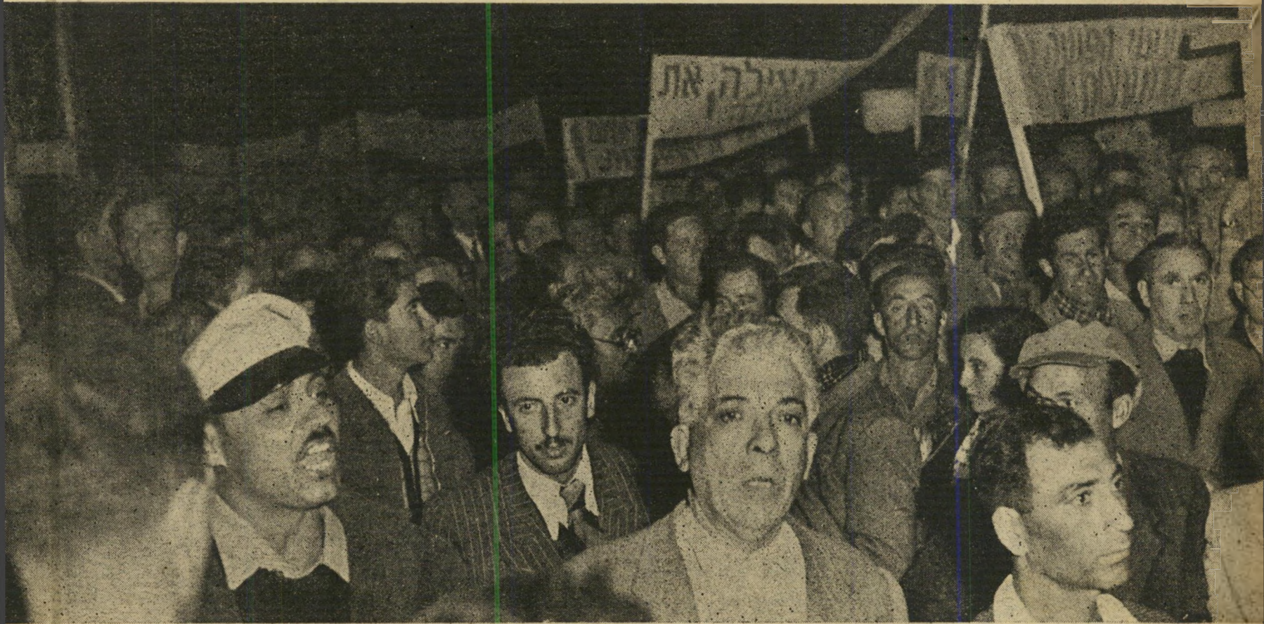
סיסמאות בלידה. לפני הצירות הסובייטית נעצרה ההפגנה. משך קרוב לשעה חזרו המפגינים על הסיסמאות שהושמעו ברם-קול מעל גבי מכונת משא קטנה. המפגינים היו מגוונים ביותר