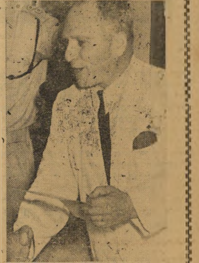
שר-המשטרה כבוד שיטריה במקום מקרר ללא חוק —