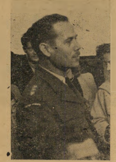
עוזר-מפקח-מחוזי בודינגר למפקד הפעולה, הפתעה קטנה

המשפט: הקצין יצחק בודינגר והממונים עליו לא פעלו למען השמירה על החוק והסדר, אלא כדי למלא את שאיפותיה הפוליטיות המיוחדות של מפלגת-פועלי-ארץ-ישראל, שהיתה או הלוחמת העי-