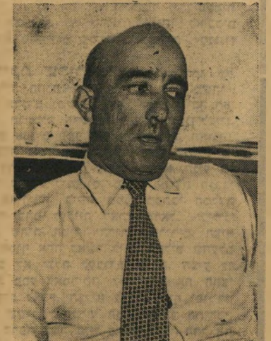
חיים כהן, שר המשפטים מבחינה חוקית, בסדר

השערתו על זהות המחברים לדעת ה-ירושלמים הן שלוש: מעשה קונסד הסר-אחריות או מבצע יחיד של חולה-רוח. האפ-שרות השלישית: פרובוקציה של צעירים לא-אשכנזים הרוצים בדרך זו להביא להקמת מפלגה עדתית כתגובה וכהגנה נגד איומים והפליות אשכנזיים קיימים ומדומים.