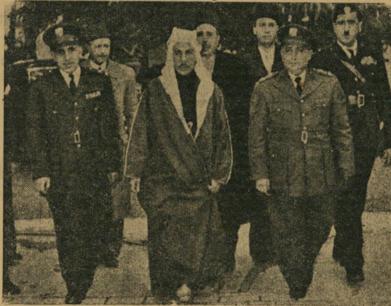
הקולונל פאזוי סלו, המלך טלאל, הקולונל אדיב שישאקקי מי המשוגע, בעצם?

חוקים במלוא הקצב. מאז הפך הקר- לונל פאזוי סלו מועמד לתואר המושל שהוציא את מספר החוקים הרב ביותר אי פעם. כשר הבטחון חתם על חוקי חירום ומשטר צבאי, כשר המסחר הוציא חוקים נגד חברות זרות, כשר החינוך הורה להקפיד על לימוד היסטוריה ערבית, ואיסור כל פעולה פוליטית בקרב הסטודנטים, כשר החקלאות פירסם תקנות לחלוקת אחוזות גדולות ה שייכות לממשלה או שאין בעלותם ידועה לפלאחם חסרי-אדמה.