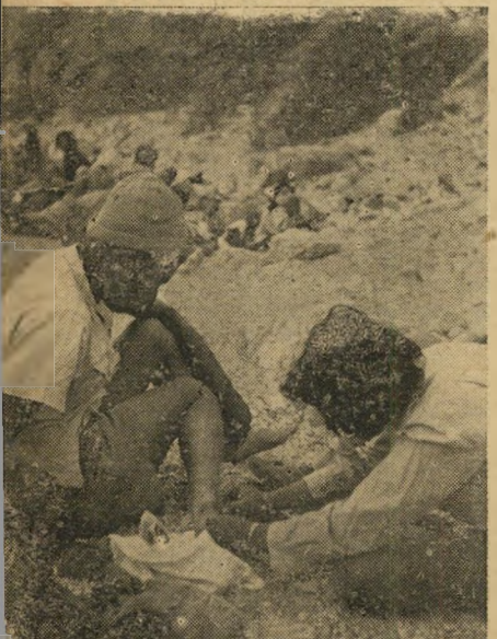
אותות כרגלים המיוסרות...

מיד לאחר שהערבים הספיקו להתחמם, קמו כמה מהם ואספו מהם השיחים שנערמו ליד המדורה, הוציאו מן האש גחלים בוערים והדליקו לעצמם מדורה נכרדת, מרחק כמה מטרים ממדורתנו. בידוד זה לא נבע מיהי- רותיחה, אולם לבני מדבר אלה חוש המשמעת שיאפשר התחברות אתם. אילו נקי- בעו יחסינו אתם על בסיס חברותי ושוייון