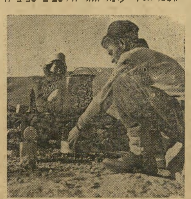
זאבה, הטבח הזמני...

פתאום נפסקת השירה. חברה! צועק מישהו, הגמלים הגיעו!