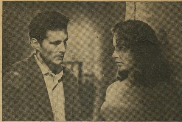
הדרמה הסוציאליסטית הכבירה שכל אחד חייב לראות! תוצרת צ'ינז מופץ ע"י מרקו מסרי ובניו

הסרט האיטלקי הגדול שזכה לפרס ראשון בפסטיבל של ונציה.