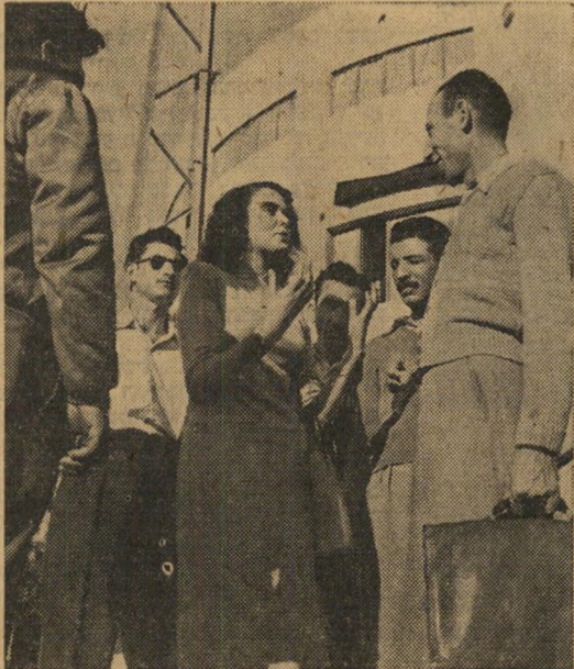
"זוהי בושה!" צעירה שהושפעה על ידי הודעות המשטרה מלמדת אותו פרק בנימוסי דרך קבל עם ועדה. אישה אחרת אף סטרה לו על לחיו מרוב התרגשות. "אתה פושע!" היא צעקה. "אתה מסכן חיי ילדים תמימים."

מאידך לא יכלה המשטרה להרשות להפקרות הולכי הרגל להמשך