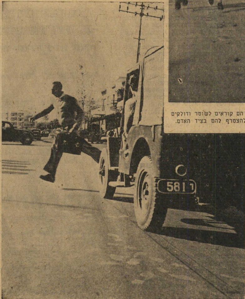
זינוק מסוכן. "חמור!" צעק נהג הגיפ לאיש האפור הוא זינק בדיוק לפני גלגלי המכונית, העמיד את חיייו בסכנה. אילו נהרג היו מן הסתם מאשימים את הנהג בנהיגה רשלנית, שולחים אותו לבית-הסוהר, — ובביתו היה משאיר אלמנה ויתומים.