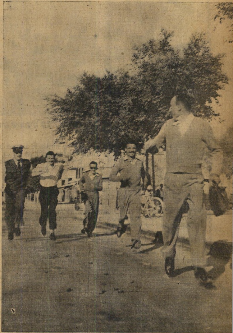
תפוס אותו!" כמה בחורים הכירו את האיש המסתורי. הם קוראים לשוטר ודולקים י"ו ברחוב, מעוררים צעקות והמולה, קוראים לעוברים להצטרף להם בציד האדם.