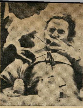
עבדול חמיד זנגאנה, איראן רצה הסכם עם אנגליה