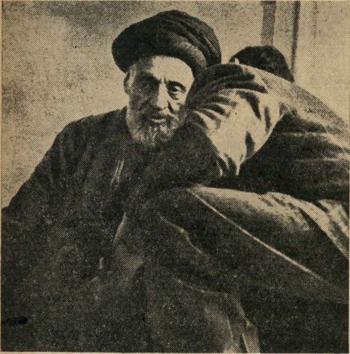
שייך איאת אלה אל-איקשאני, ראש "פדאיאן איסלאם" הרופא בעזרת האקדח

טלא, נסיך עדין נפש וחם-מוג, לא סלח מעולם לאביו את העלבון שנעשה לאמו. כי בנשאו נשים נמוכות בדרגה ובמוצא מהנסיכה, אם טלא, השפיל עבדאללה את כבודה. במרוצת הזמן, התפתחה סינה זו לשנאה גלויה של הבן הבכור לאביו. בזה נהנה טלאל מאהדתם של רוב נתיני אביו, שחשו את העלבון