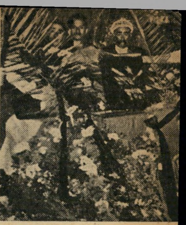
זומארא, איראן לחלק אדמות

אחת ויחידה: מדינה ערבית מאוחדת שתקיף את כל המרחב, חופשית מחלות בורים, עומדת ברשות עצמה.