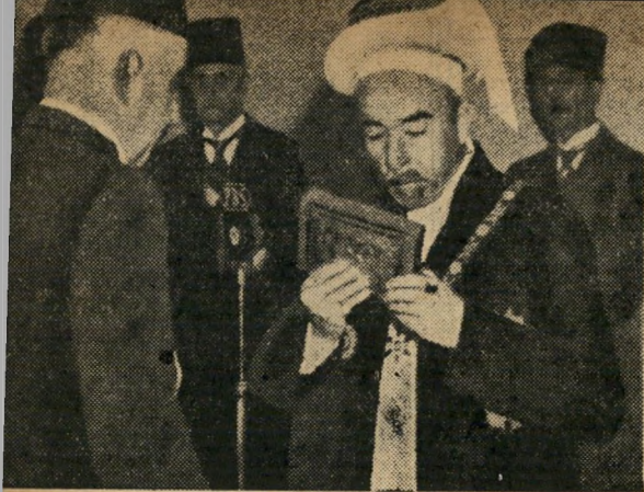
מנכ"ח עבדאללה איבן חוסיין, הירדן רצה פשרה עם ישראל