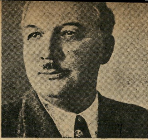
ריאד ביי אל-פייז, לבנון לא הסכים לסיפוח