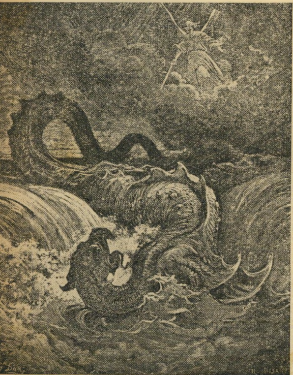
„יפקוד ה' בחרבו הקשה על דויתן...“

שכוכב חדש הופיע בימיהו. השומרוני שמו כי בימי פלישת יהושע לארץ הופיע כוכב במזרח. לבבלים הקדומים היו רק ארבעה כוכבי־לכת. אי פעם הופיע כוכב המשי. פיטאגורס אמר שאחד מהם משת כוכבי־הלכת הוא כוכב־שיביט. כהנתו היתה לדעת וליקובסקי, לנוגה, שהיה כוכב־שיביט אך הפך כוכב־לכת, אחרי שבא במגע עם כדור־הארץ. לנוגה היה זנב. המסקיקאים קראו לו „כוכב מעשן“. לכנענים היה „עשתורת קרניים“, מפני שבאותה תקופה דמה לראש בעל קרניים. עגל־הזהב שהוקם על־ידי אהרון לא היה אלא דמות הכוכב. עגל אחר הועמד על־ידי ירבעם בן, עבודת השור פרוחה באותה תקופה בכל העמים. כיום אי־אפשר לראות את קרני נוגה אלא במשקפת חזקה. גלילי ראה אותם ראשון. נוגה הוא עשתורת הבבלית, אתונה היוונית, מינרבה הרומית, כוכב־הבוקר וכוכב־הערב. כל עמי העולם עבדו אותו בצורה זו או אחרת, החל ממצרים האלף השני לפני־הספירה, היא תקופת יציאת מצרים. חגו חל יחד עם חג הפסח הישראלי, החג שבא להנציח את שואת מצרים, שאיפשרו את היציאה הגדולה.