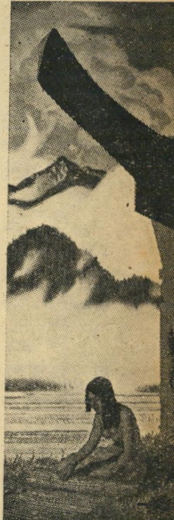
ליבריאני קרוב לנוגה