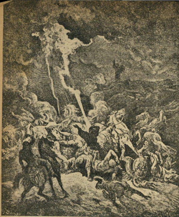
„והנה ענה עשן העיר השמימה...“