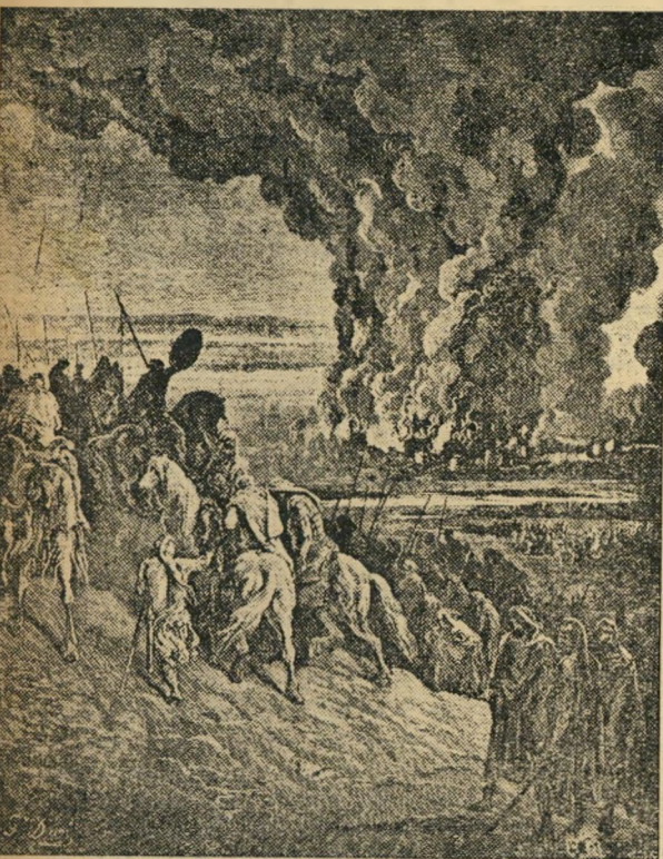
„ותרד אש מן השמים...“