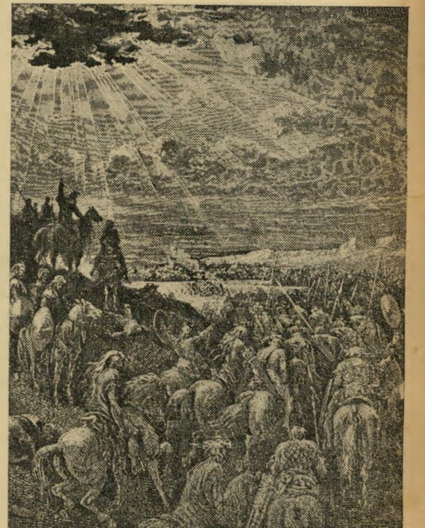
וה' השיך עליהם אבנים גדולות...