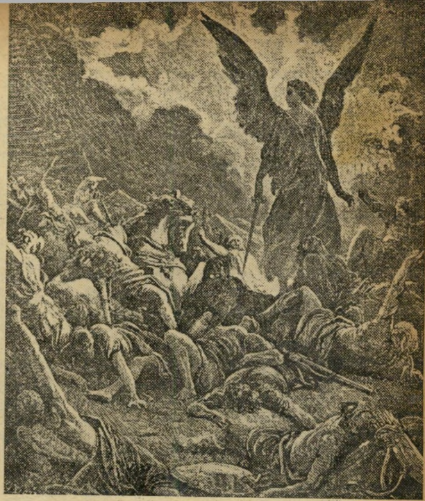
ויצא מלאך ה' ויך במחנה אשור...

חליקובסקי מנסה להסביר אותן בעזרת הפולקלור של עמים שונים, רחוקים זה מזה — התנ"ך, אגדות