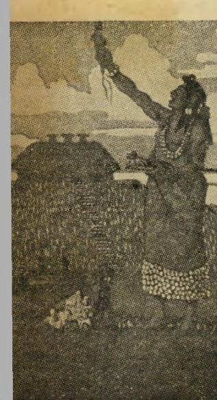
כהן אינדיאני מראה הלילה