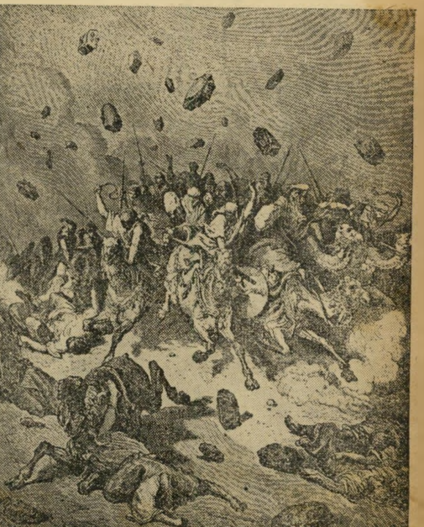
שמש בגבעון דם, וירח בעמק אילון... צבא אלוהים הוא...