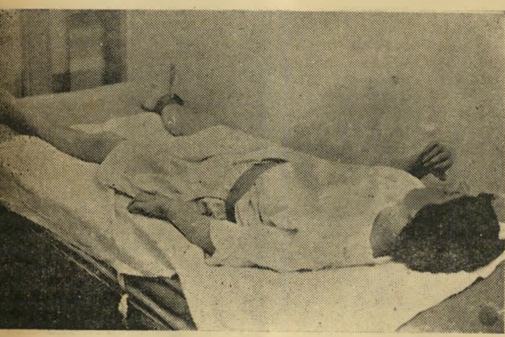
חוסר הכרה. אחרי הזריקה נשארת החולה לזמן מה מחוסרת הכרה. כאשר תחזור, תהיה שקטה יותר, נוהה יותר לטיפול הפסיכולוגי של הרופאים.