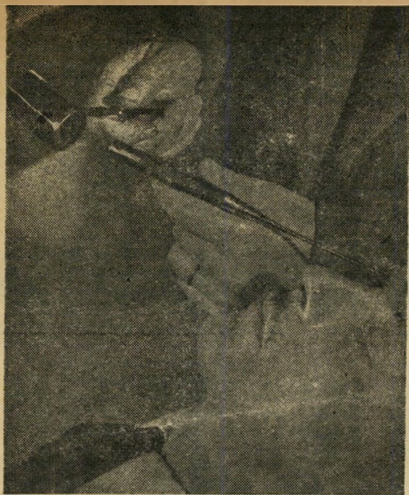
הפוליטיקה והדמוח. באנגליה נעשה ניתוח מעניין: מכניסים לראש בני אדם לוחות המוח המצחיים, מעל לעין. הדבר מנתק את היסוד המוח והופך את האדם לאוטומט ללא כוח רצון. פיתוחים שזהו סוד היידיזם במשפט הסובייטי. זמן הניתוח 2 דקות.