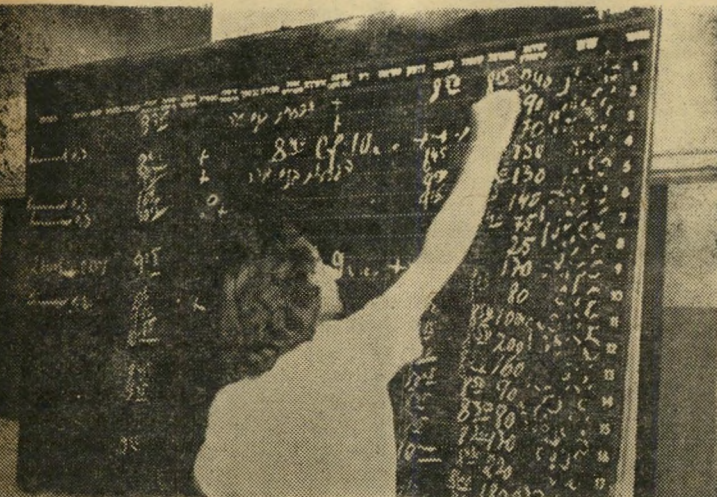
הכל לפי השבון. בחדר הטיפולים נמצא לוח גדול, עליו רושמת האחות האחראית את שמות החולים, מספר ותכיפות הזריקות שהם מקבלים.