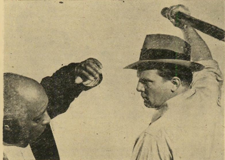
"אורח לא קרוא": ישוב החשבון בתולה זקנה זווקת-אופי...

לרוב אשה קלת דעת. לינדה דארנל נולדה בדאלאס, במדינת טקסס, לפני שלושים שנים. אינה נמצאת בסביבה זרה בסרטי המערב. מילדותה החלה מכשירה עצמה למשחק; למדה, לאחר שעות בית הספר, בו הצטיינה בלימודיה, באקדמיה דרמטית. כאשר הגיע בא כח חברת הוליוודית לעיר מולדתה, הלכה לראותו, עשתה רושם טוב, נשלחה להוליווד למבחן, עשתה רושם שם מצוין, הוחזרה הביתה. הסבה: צעירה מדי. היא היתה בת שמונה עשרה, לא התיאשה, הציגה לראוה את גופה בהצגות רביון על שטח.