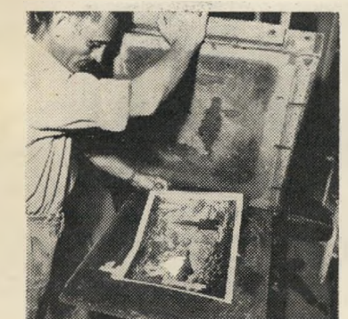
הציור המודפס: בעד חורי המשי

— וויריאם או'דוויאר, השוטר האירי, שעלה לדרגת ראש עיריית ניו-יורק, ושגריר ארצות הברית במקסיקו, בה הוא מבלה עם