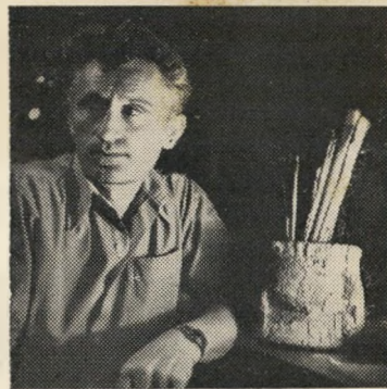
הצייר: יואל רוהר