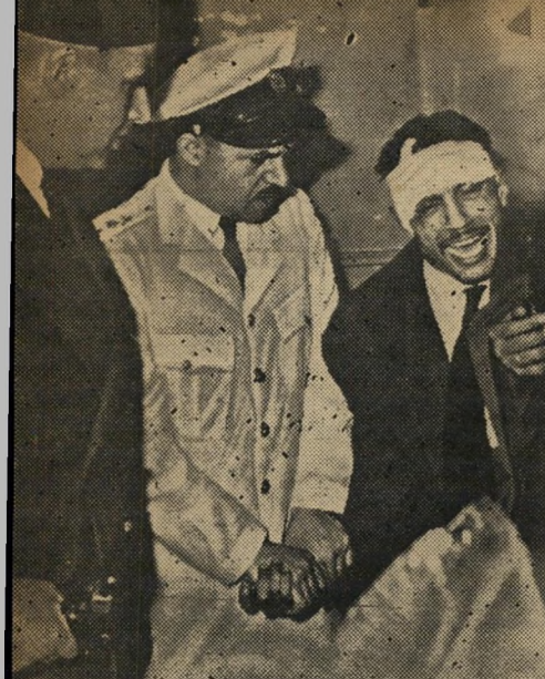
מוחמד בסינוי, פושע משוה הניע לרצוח

עתה, עם סיום המצב הצבאי, הוחזר גם הרכוש. אלא שהאחים, המונים למעלה מ-60.000 חברים במצרים בלבד, החליטו לחזור לזירה החפשית בהפגנה אדירה. הם ציוו