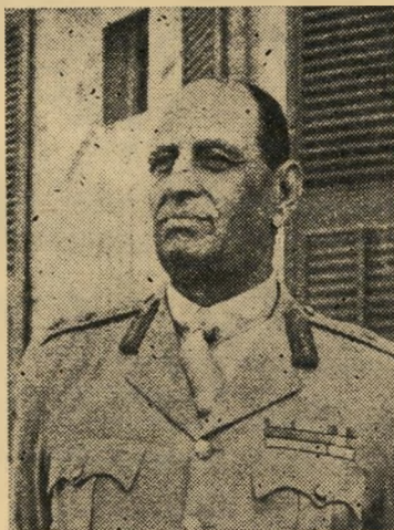
מוחמד חיידר, מפקד החללים לא ישוב

אחוזות, הניתנים להשפעת המרכה במחיר, אלא ברפובליקה העממית האיראנית, שהתנגדותה תהיה חריפה ועקרונית ביותר.