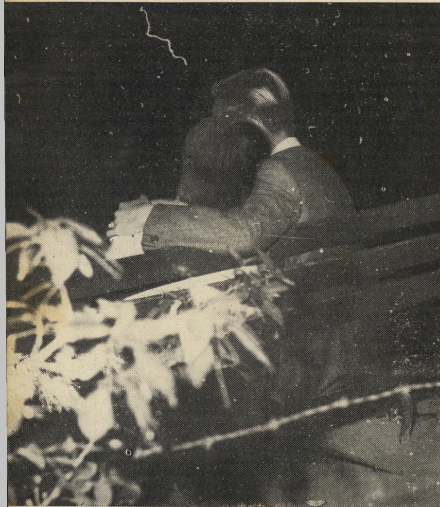
ידידות תלמידית: אחת המעלות של בית הספר, בעיני תלמידיו, היא שקל לבנים ולבנות להכיר איש את רעותו. אולם הגיל אינו מאפשר זוגות בני אותה כיתה: תלמידת השביעית מתרועעת עם בנים שגמרו את ביה"ס; תלמידי השביעית מתרועעים עם בנות החמישית — זהו גם חסרונה החמור של תנועת הנוער, בעיני נערים הרוצים ביחסים חברתיים.