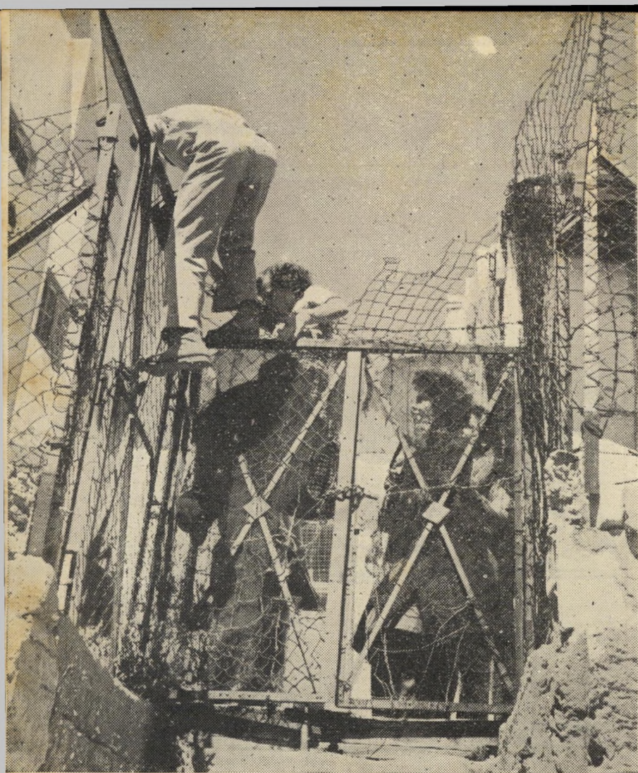
קצרה הדרך לחרות: צריכים רק לספס על גדר כדי לצאת לרחוב. הרבים המשתמשים בדרך זו מתמרמרים: היא קורעת את המכנסים. לשם מה יש בכלל צורך בגדר תיל? מי שכפוהו להשאר בכתה לא ילמד ממילא, כשמחשבותיו מלוות את חבריו שהסתלקו מן השיעור.