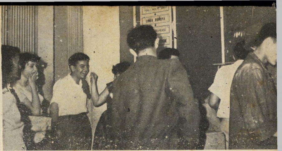
כיתרת בקולנוע: ה"טפסים" יושבים בכתה. הפקחים החתלקו משעור משעמם, לתמר.