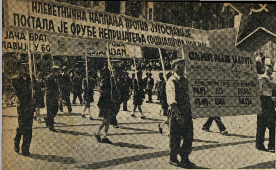
יוגוסלביה משיבה מלחמה: הפגנה אנטי־סובייטית בבלגואד, הסיסמא אומרת: "מלחמת השקרים נגד יוגוסלביה נותנת נשק לאויבי הסוציאליזם". טיסו טוען שסטאלין בגד.