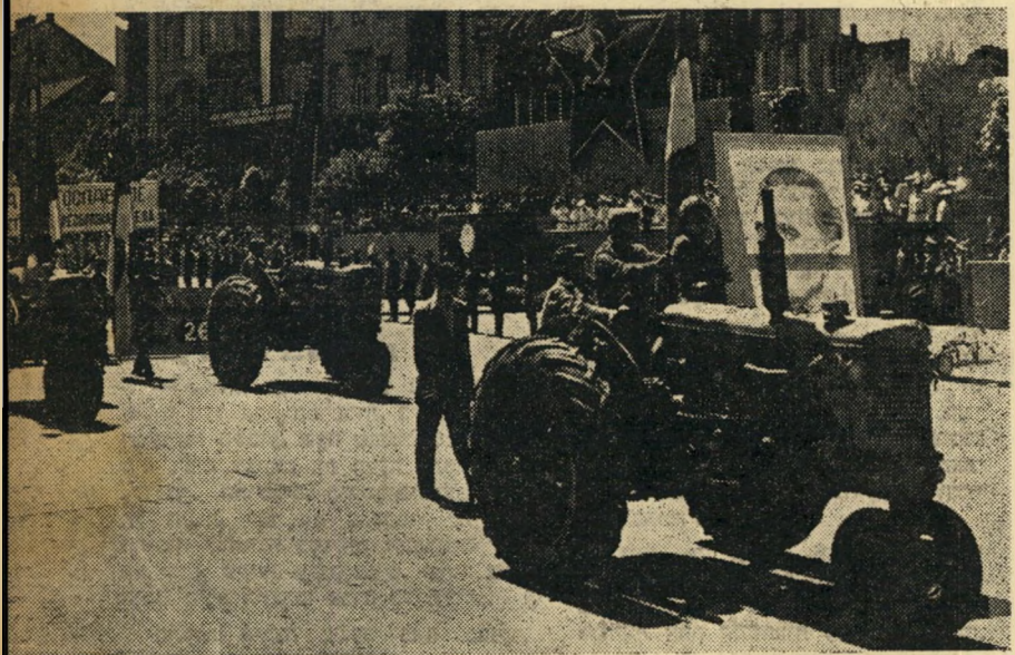
"תוצרת יוגוסלביה": לפי "תכנית החומש" של טיסו, מקריבה הארץ קרבנות עצומים כדי להקים תעשייה משוכללת. טרקטורים אלה יוצרו במחיר לחם ובגדים. אך הם יוצרו.