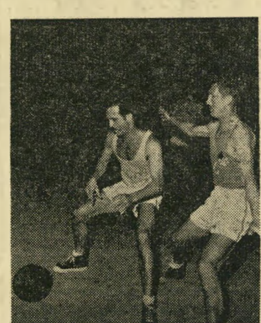
קורמן, גרבי, עז יד הכדור להרוג זמן

פאול אחר. לוא היה אותו שחקן "מכבי" תל-אביב חושב, מה עלולה לגרום פגיעה אישית אחת, היה נמנע לעשותה. מצב הנקודות היה שווין ברוך — 34:34 השח קנים והקהל התלהבו עד כדי היסטריה. כל מקרה פטוט גרר צוחות וצעקות עד לב השמים. לא ברור אם התזה, פאול מקרי, או זריקה בלתי מדויקת לכוון הסל; השח קן הצעיר, של "מכבי" תל-אביב, איפשר לאריה איסרוב לירות זריקה חפשיה, להע" לות את מאון הסלים 34:35. בקבוצתו