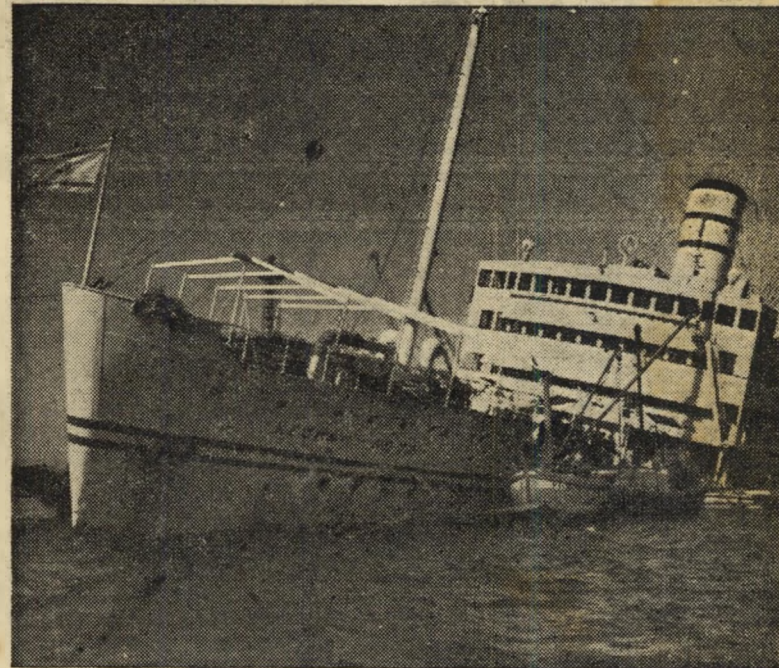
האניה "קדמה" וסירת האמודאים

על "קדמה" היו אותה שעה רק מעטים מאנשי הצוות, אולם אלה לא אבדו את קור רוחם. בעת שהנוט הפנה את האניה, המלאה מים עד מתציתה, לעבר החוף, הצליחו לסגור את הדלתות המפרידות בין החלקה למחלקה. חדר המכונות פעל גם