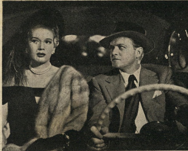
וואן הפליין והאמוזנה ((נשמות נבוכות)) גוף מפותח, משחק חתולי

השינוי הפתאומי בגופו של השופט - כשנשמה של גנגסטר שוכנת בקרבו -