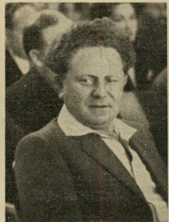
ישראל גדידי ימני בים השמאל

נזכרו, איפוא, השרים הדתיים שה' גיעה השקעה להחזיר את עטרת השבת ליושנה. והנה מתברר שהטוב בעיני הדתיים, מתקשר יפה עם המועיל (בעיני