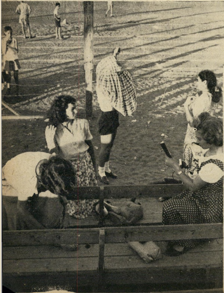
שוקת לסיסים או בית-מרחץ? גם ברוז ערוב זה נמצא מחוץ למגרש. כאן "מתקלחים" ספורטאינו אחרי יום אימונים ותחרויות מייגע על המגרש. הפלא הוא ששרדו רק מתי מספר?