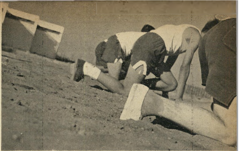
"למקומות, היבוק, רויק!" — אבל איך אפשר לרויך, כשכפות הרגלים שוקעות בחול הרך? מלבד הגשם לא טרוח איש לרביץ את המסלול מאז נולדו הרצים, והאדמה התפוררה.