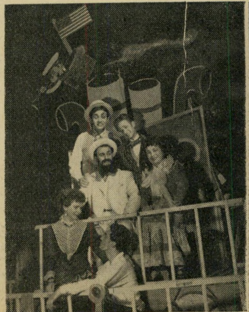
כוכבים נודדים ב"קאמרי" ...והגלות עודה נמשכת.

שחקנים לא רעים (שימו עין על רותי. בכלל כדאי להסתכל עליה) במאי מצוין. אבל מה להציג לא היה. כי יחסו של המחתר לסופרים כבר היה מפורסם. לא רצו לכתוב. (המשך בעמוד 18)