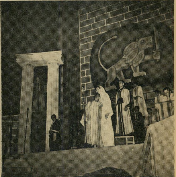
מגילת העצמאות ב"להקת הכרמל" הבית השני נחרב...