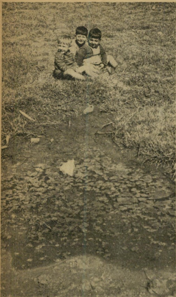
יש שפע של מים ביהוד — בתוך שלוליות ברחוב. מצב המים ביהוד המור ביותר, אולם את הבארות הערביות עדיין לא תקנו. המים עומדים בכל התעלות ומהווים סכנה גדולה לבריאות התושבים.