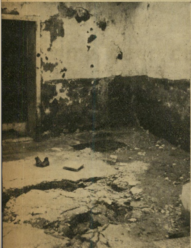
לפני שנה וחצי נכנסו התושבים הראשונים. עד הכתים המהווים סכנת נפש לילדי המקום. תליח הנזכי שילדי התושבים רואים לפני בתיהם את הלך משלהם במקום לדאוג לנקיון ה