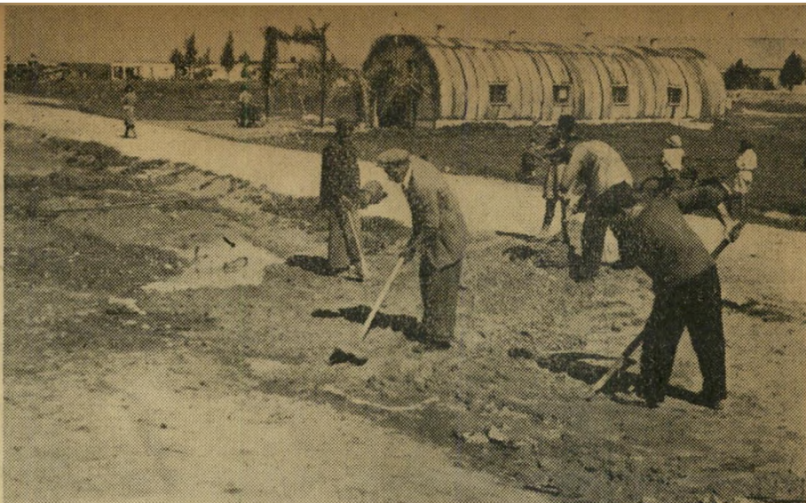
הפועלים מנקים את הרחוב בו יעבור השר בדרכו למסיבה. השעה 13.45. את האשפה מעבירים לרחוב השני.