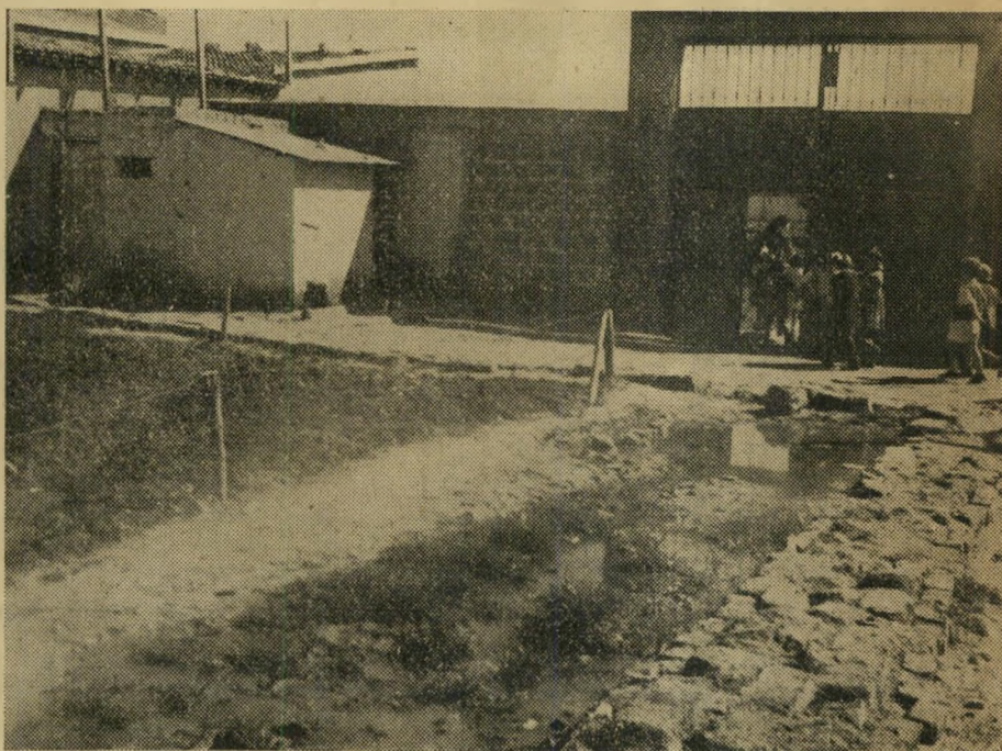
בבית הספר הכללי לומדים למעלה ממאה ילדים. לבית השמוש האחד אי אפשר להכנס, כי הזוחמה עוברת כל גבול. מי השופכים עומדים בכל החצר. פקידי משרד הבריאות בקרו כבר במקום, אך הכל נשאר והילדים משחקים בין זרמי מי השופכים.