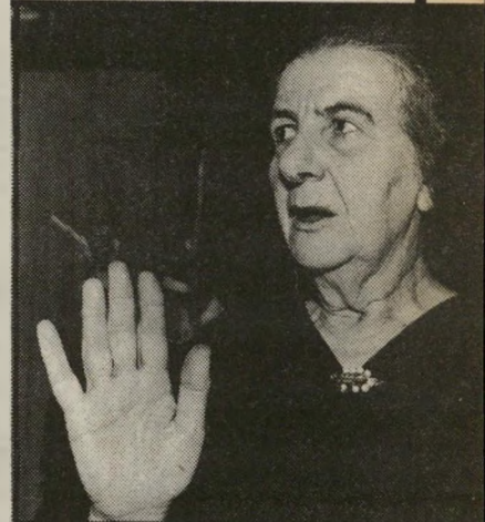
גולדה היא לא רצחה לשמוע