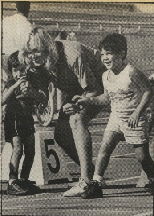
איל דסלת העולם הזה