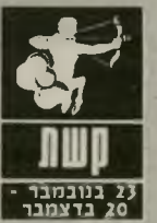
קשת 23 בנובמבר - 20 בדצמבר