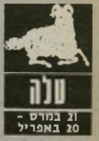
טלה 21 במרס - 20 באפריל

הקריירה עומדת עכשיו במרכז העניינים. דורשים מכם עבודה טובה יותר. זה אתם שחובטים מעצמכם אך הוצאה זהה בין כה וכה. קישרי אהבה עשויים להחרש, אך חשוב לשר מור על סודיות. יתכן שזה יתחיל משיחת-סלפון תמימה או אולי אפילו נלויה או מיכתב, אבל משהו יתחיל לזוז. מתח בבית בחו. אולי כדאי לבלות במקום אחר. ה-15 וה-16 מראים על אפשרות לזכות בחירות נסו את מולכם והשקיעו, אך בוהירות.