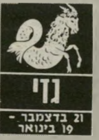
נדוי 21 בדצמבר - 19 בינואר

הזו בחודש אינו מתאים לפגישות, לפיזיקים ולעניינים חשובים. זה לא יום נעים. ה-12 הרבה יותר מודר. מצב הרוח יתחפר, מישוה, שיבוט לבקר או שיצלי צל יגרום לכך הביטחון העצמי יגלה, ולפחות למסרמה תשובו לשלום כענין שנשמט מידים באחרונה וגורם לכם הרבה רגשות טובים. פחות טוב תרועו ב-13 וב-14. אל תחבנו תוכניות הדור שות סכם מאפן. ב-15 בחודש תתחילו להרגיש הקלה. החרשקו מחלונות-הראווה.