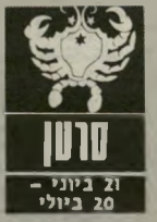
סרטן 21 ביוני - 20 ביולי