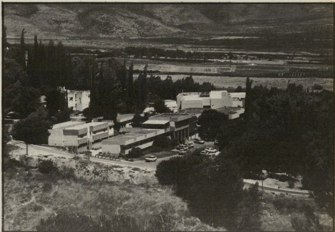
מראה כללי של מיכללת תל-חי: הנוף וההיסטוריה

ניתן לומר שסטודנט במיכללה מק-בל יחס אישי וחם, המתבטא בדברים ממשיים ושהותו במקום הופכת לחווייה מתמשכת לאורך כל שנות לימודיו במיכללה.