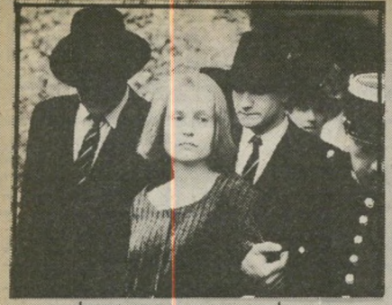
איזבל הופרט — מוות והפלות

איש זקן בעל כנפיים גדולות (סינמטק, תל-אביב, ספרד/קובה) — עוד החמצה בסידרת העיבודים לסיפורים של גבריאל גארסיה מארקס לקולנוע. האחראי הפעם הוא פרננדו בירי, אוונט-גארדיסט ותיק, שהחליט כי כוונות חשובות יותר מתוצאות. מארקס מספר על מלאך נישש בעל כנפיים גדולות וכבדות, שנופל בחצר האחורית של ביקתה עלובה. בין לילה הוא הופך לסנסציה של העיירה, כולד רוצים לגעת בו ומצפים שיעשה ניסים ונפלאות. בעלי הביקתה, עניים מרודים, מוכרים כרטיסי גישה ליצור המופלא, ועד מהרה משפרים את מצבם הכלכלי ללא היכר. הכנסיה מוטרדת מניסים שאינם בפיקור"חה, אבל אינה צריכה לדאוג. ההמון הנהר היום אחרי מלאך, ינהר מחר אחרי אשת עכביש ומחרתיים אחרי תופעה משונה אחרת, והמלאך האדיש והתשוש יוצא עד מהרה מן האופנה. אין צורך להרבות בפרשנויות כדי להסביר