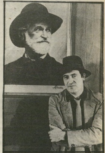
בימאי ברטולוצ'י משחזר ההיסטוריה

אין הצלחה יותר בטוחה מן ה"הצלחה" סיסמה ישנה, אבל מוכיחה את עצמה שוב ושוב. כרנארדו בריטולוצ'י, חתן האוסקר מן השנה שעברה (הקיסר האחרון), החליט